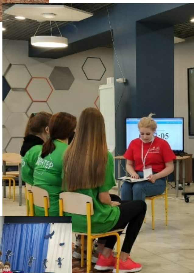
5. Работа с басней «Стрекоза и муравей» - интегрированное занятие по речевому развитию