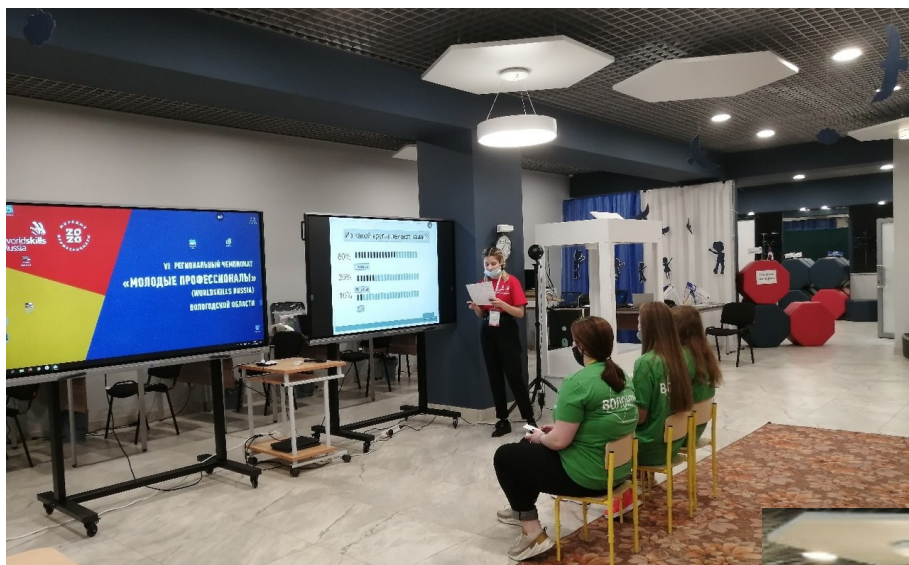
4. Презентация проекта «Путешествие зернышка»