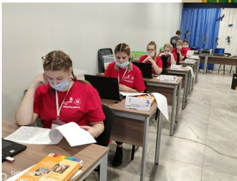
6. Идет подготовка задания